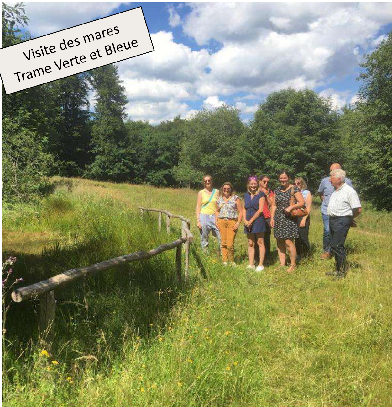
Visite des mares Trame Verte et Bleue