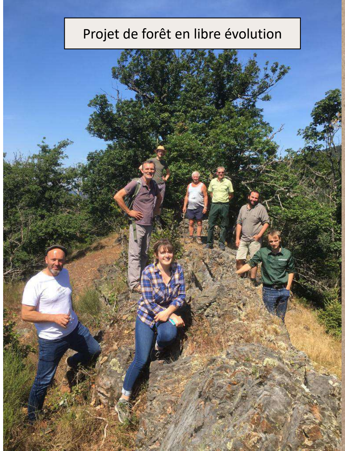
Projet de forêt en libre évolution