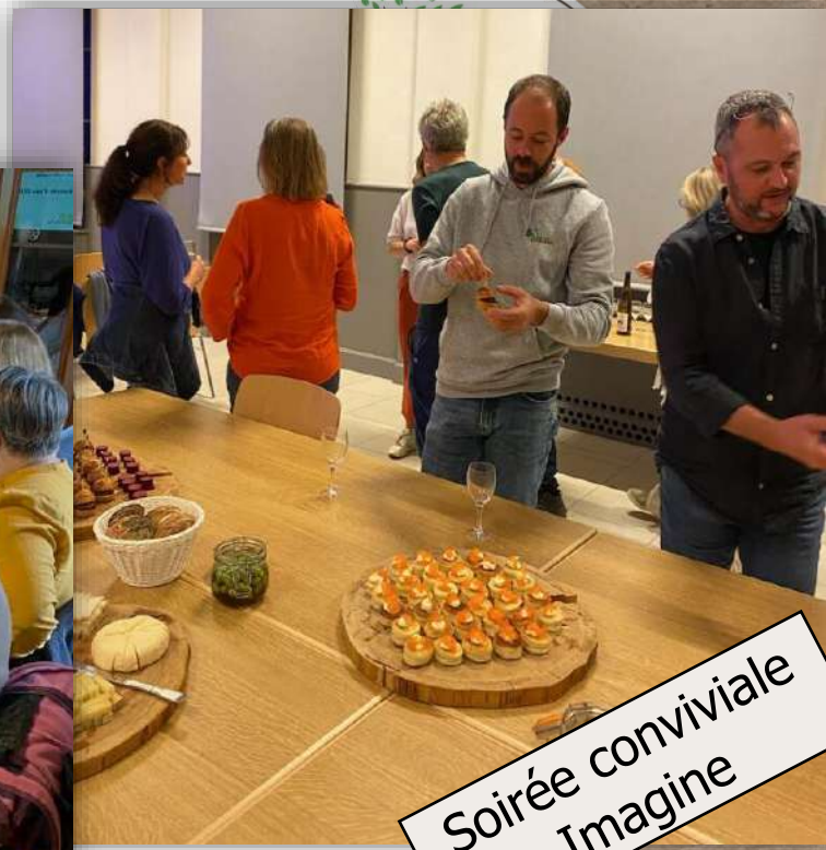
Soirée conviviale Imagine