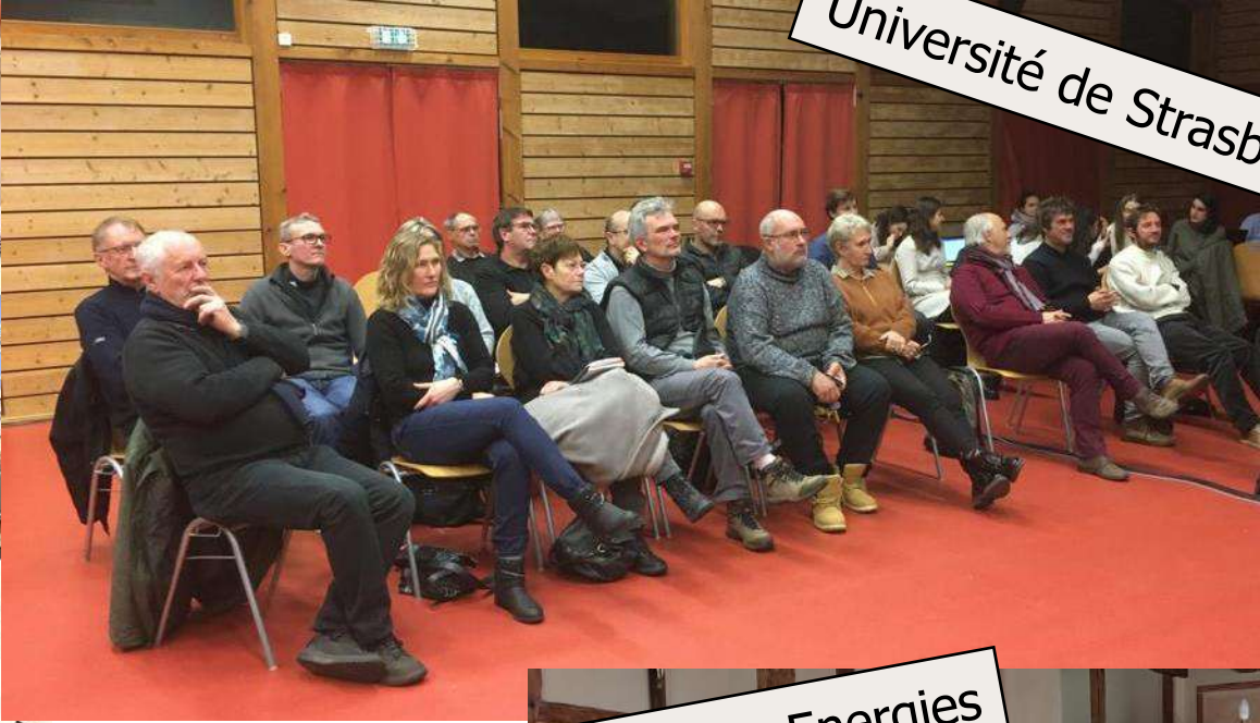
Alter Alsace Energies